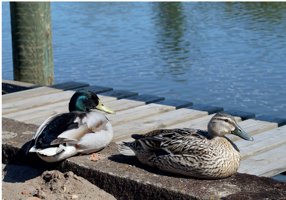
Gråænder er blot én af mange vilde dyrearter, der er flyttet ind i byerne.

I byens villakvarter nyder Mikkel Ræv sin søvn, inden det bliver mørkt og dermed tid at gå på jagt efter mus, fyldte affaldssække og hvad der ellers findes