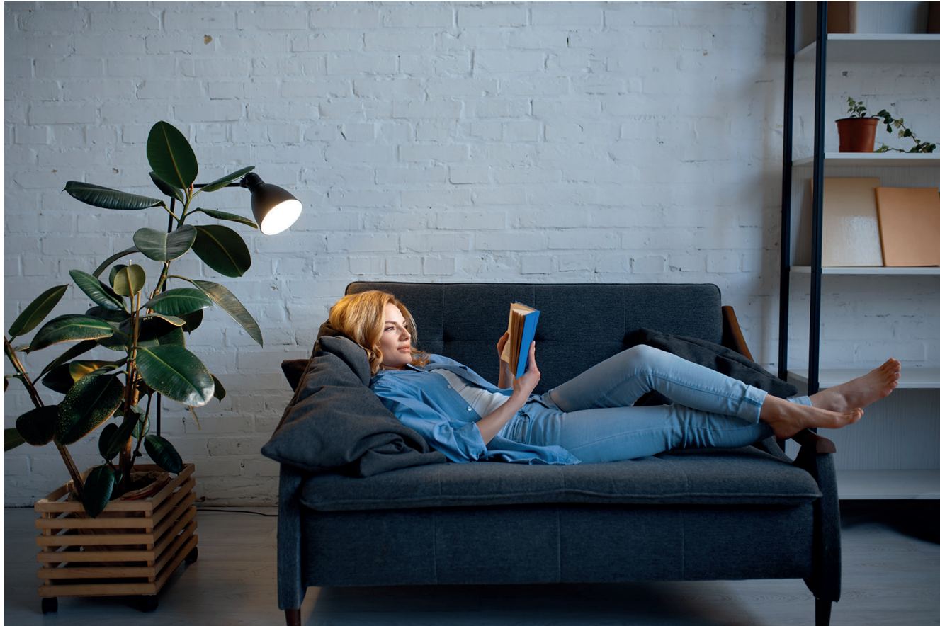
Lyskilden skal være designet og placeret, så behov og funktionalitet passer sammen.

Det er ikke ret mange år siden, at det klimavenlige valg af pære til lampen virkelig skulle overvejes grundigt. De første generationer af el-spare-pærer var både længe om at nå op på fuld lysstyrke, fra man tændte, klodset udformet og vildt dyre. De udsendte